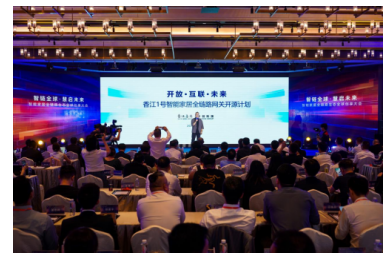
“万能网关”横空出世！全球首个跨协议智能家居系统广州破壁