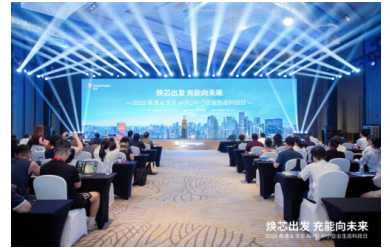
亿道数码携骁龙AI PC矩阵亮相高通科技日，定义移动办公轻时代