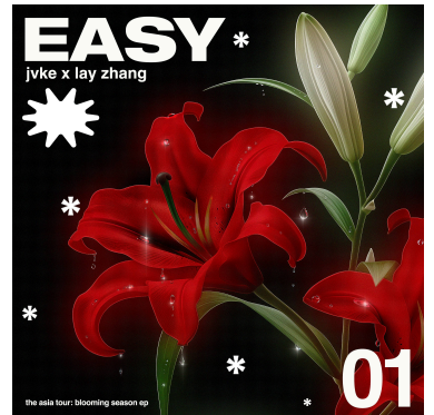
《easy》上线，JVKE携手张艺兴共鸣“说不出口的爱”