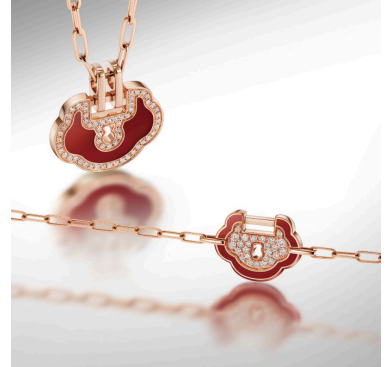
汉服与天然钻石融合，演绎独属于中国人的中式浪漫