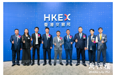
周六福珠宝股份有限公司首日挂牌受追捧