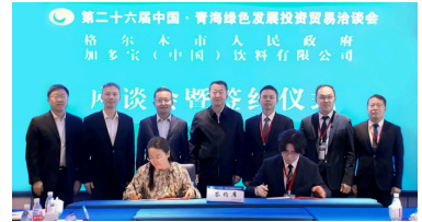
昆山山矿泉水重磅亮相第26届青洽会 一期扩能二期建设项目签约