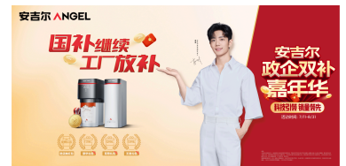
安吉尔启动政企双补嘉年华活动，以多重钜惠回馈用户