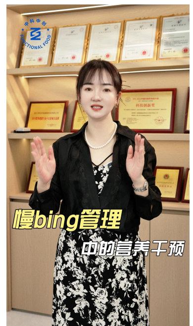
中科创业麻籽：慢病管理中的营养干预