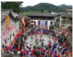
安顺地戏展非遗风采