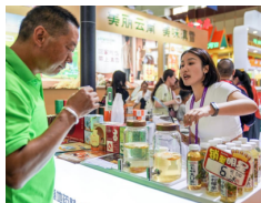
探馆南博会 品云岭好物

在全球化与数字化浪潮的冲击下，如何主动求变，推动外语学科转型，适应时代变革，成为外语类院校的重要课题。上海外国语大学贤达经济人文学院作为一所特色鲜明的民办外语类高校，是全国25所外语类高校之一，始终坚持“为党育人、为国育才”使命，全面贯彻党的教育方针，落实立德树人根本任务；坚持“五育并举”，全面提升学校人才培养质量，培养德智体美劳全面发展的社会主义建设者和接班人。