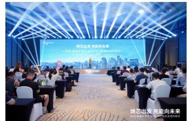
亿道数码携骁龙AI PC矩阵亮相高通科技日，定义移动办公轻时代