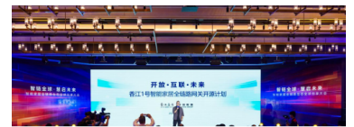
“万能网关”横空出世！全球首个跨协议智能家居系统广州破壁