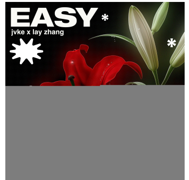
《easy》上线，JVKE携手张艺兴共鸣“说不出口的爱”