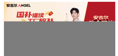
安吉尔启动政企双补嘉年华活动，以多重钜惠回馈用户