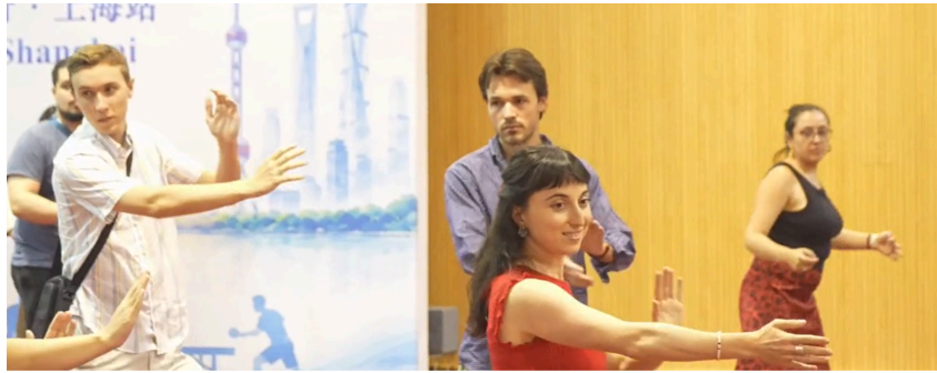
( https://www.chinanews.com.cn/shipin/cns-d/2026/06-10/news1057367.shtml ) 以运动结缘! 多国青年解锁中国体育文化 ( https://www.chinanews.com.cn/shipin/cns-d/2026/06-10/news1057367.shtml )