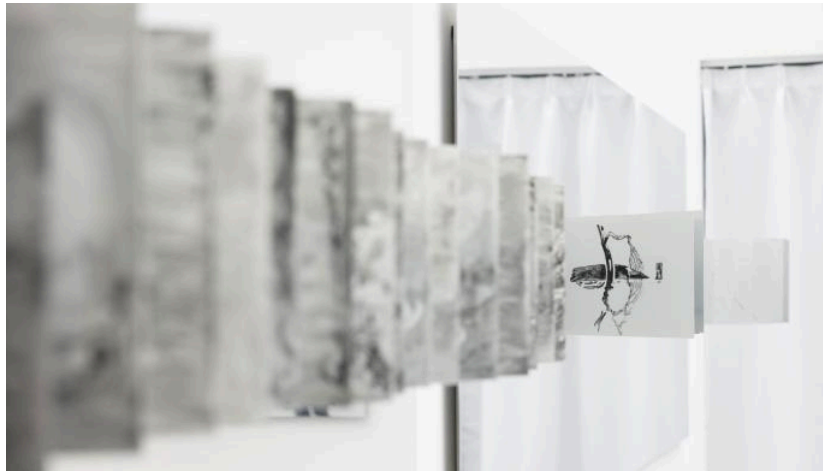
( https://www.chinanews.com.cn/tp/2026/06-10/10637961.shtml ) “新锐艺术家”刘毅首次个展《倒影离开水面之后》在沪展出 ( https://www.chinanews.com.cn/tp/2026/06-10/10637961.shtml )